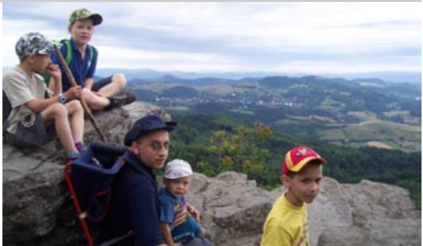
Deti i dospelí ocenia vysokohorské túry...

sú organizované na úrovni farností, spoločenstiev alebo iných hnutí.