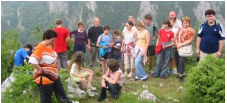
Na Teplom vrchu

dičnej rodiny. V médiách sme konfrontovaní so všeličím (od mužského páru v súťaži až po „velebenie“ celebrit s ich životným štýlom...), čo sa na tradičnú rodinu už naozaj nepodobá. Čím najviac trpí dnešná rodina a akým spôsobom jej môžeme pomôcť?